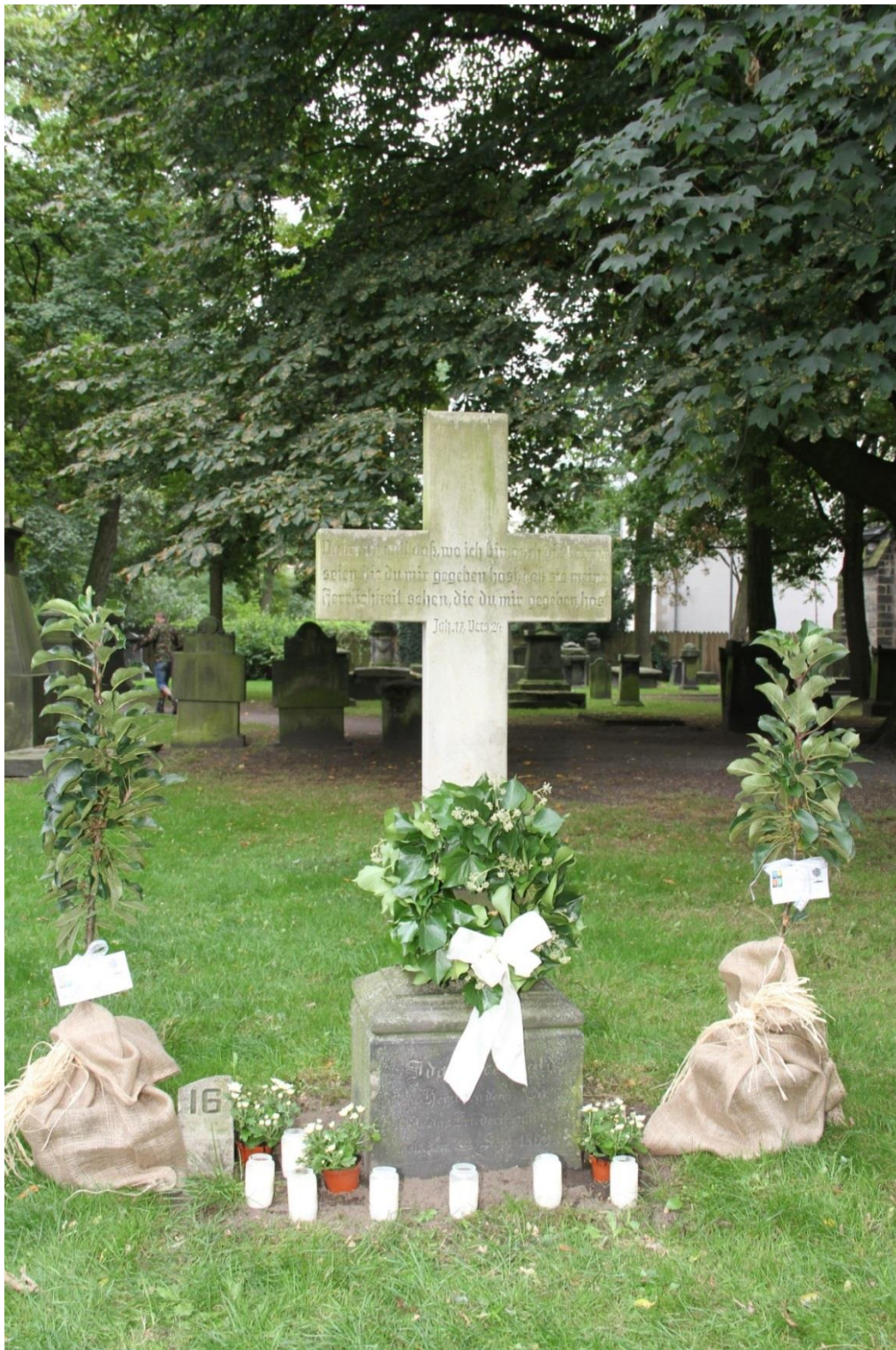
Abb.: 3 Hannover, Gartenfriedhof, Grab von Ida Arenhold