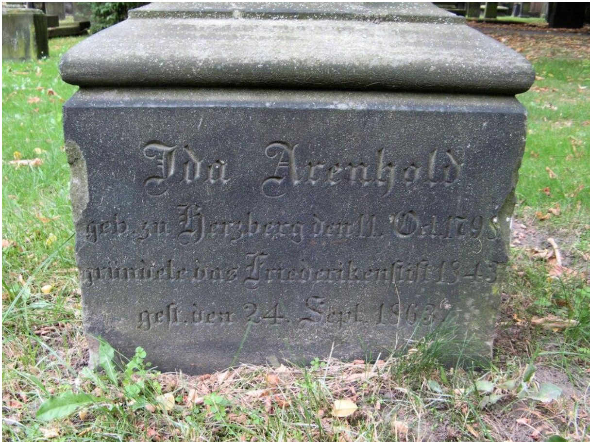
Abb.: 4 Hannover, Gartenfriedhof, Grab von Ida Arenhold, Teilansicht (Orig. u. Foto: DIAKOVERE, Bildarchiv, Friederikenstift, Hannover 2013)

Zum Abschluss eine treffende Charakterisierung von Ida Arenhold durch den hannoverschen Theologen Gerhard Uhlhorn (1826-1901), der sie vermutlich persönlich gekannt hat: