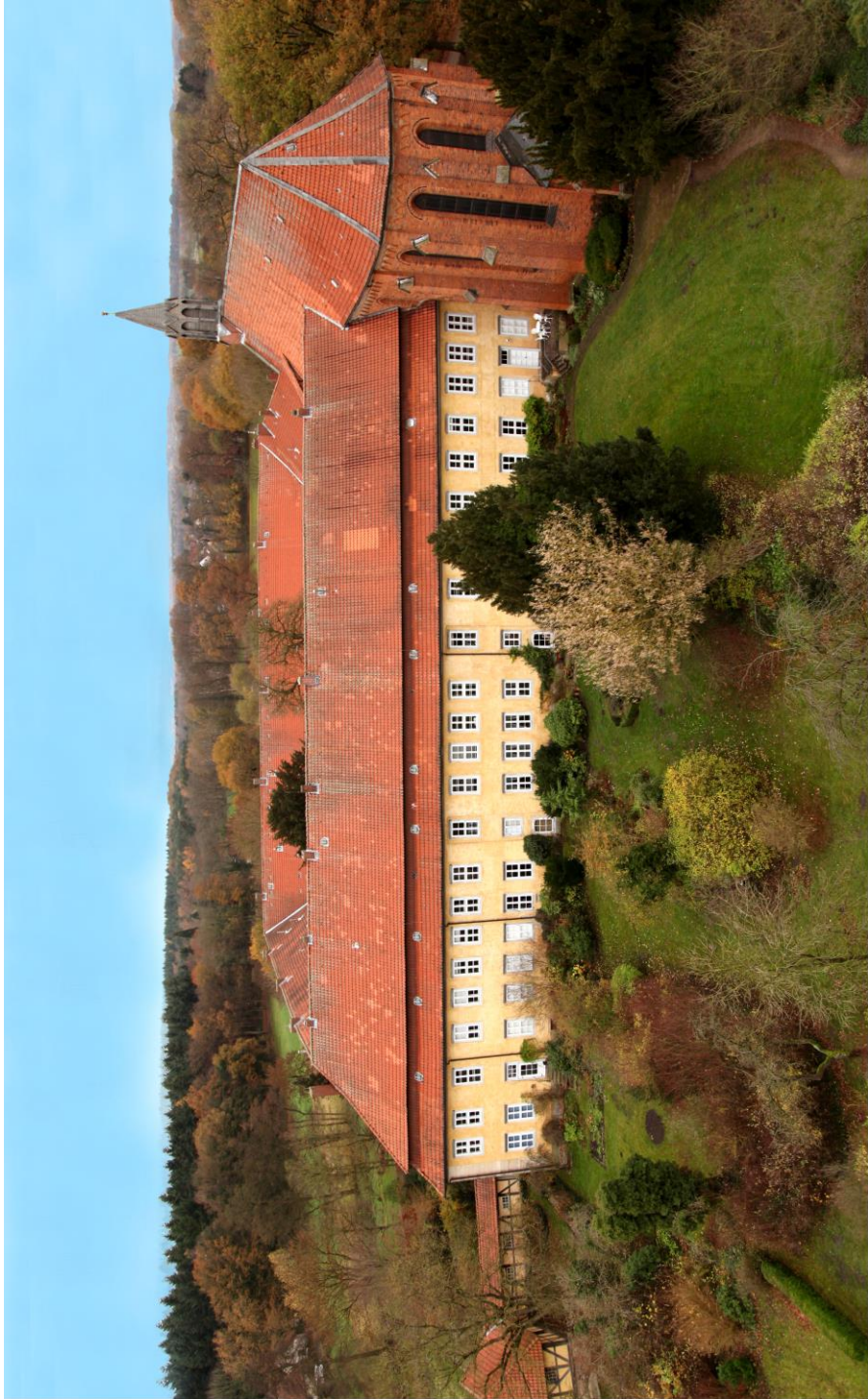
Abb.: 1 Kloster Mariensee